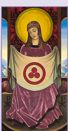
Opera di Nicholas Roerich

La Scuola rilascia regolare diploma di Counselor ed è iscritta al Registro Italiano Counselor di Assocounseling (R.I.C.A.)